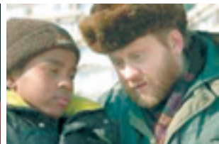
Prizor iz filma »Gagarinov unuk«