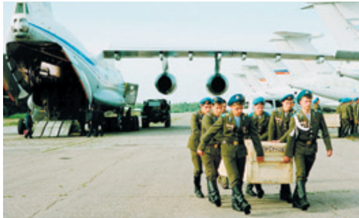
Punokrvni horor – prizor iz filma »Gruz 200« Alekseja Balabanova

M eđu suvremenim ruskim redateljima ima onih koji snimaju »patriotske« filmove o »našim momcima« pa su rado viđeni i ugošćeni kod predsjednika Putina, ali i onih koji filmove rade na antiratnom valu i vjerojatno nikad neće dobiti Putinovu pozivnicu