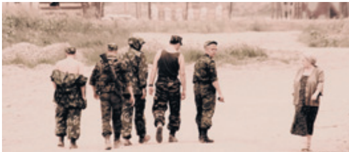
Babuška na bojišnici – prizor iz »Aleksandre« Aleksandra Sokurova

Bondarčukova audijencija kod predsjednika koji sebe voli nazivati »demokratskim« krajnje je simptomatična, jer je »9. satnja« u nablidanom patriotizmu nadmašila najrlatije socrealističke filmske izdanke iz Staljinove ere. A to Putin nagraduje. Film je to u kojem vojnici zamisljeno čuče u polju tulipana kad saznaju da ih neće pustiti na bojišnicu, i pokazuju nam kako ni vjira rata ne može zaustaviti njihovu ljubav prema slikarstvu, ali će im afganistaniku idilu prekinuti opaki mudžahedin (žrtvina krv kaplje baš na papir na kojem je crtao). A kada visoki časnik nakon obuke pita dobrovoljce je li se netko predomislio u vezi odlaska na bojišnicu, oni se tek diskretno osmijehnu ili